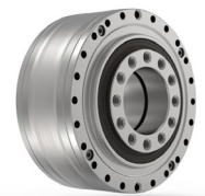
Das miniaturisierte Galaxie® mit axialem Funktionsprinzip feiert in Hannover seine Premiere

Die WITTENSTEIN SE entwickelt Produkte, Systeme und Lösungen für hochdynamische Bewegung, präziseste Positionierung und intelligente Vernetzung in der mechatronischen Antriebstechnik.